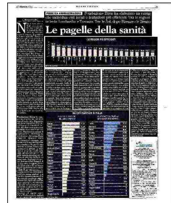
GRAFICA MF-MILANO FINANZA